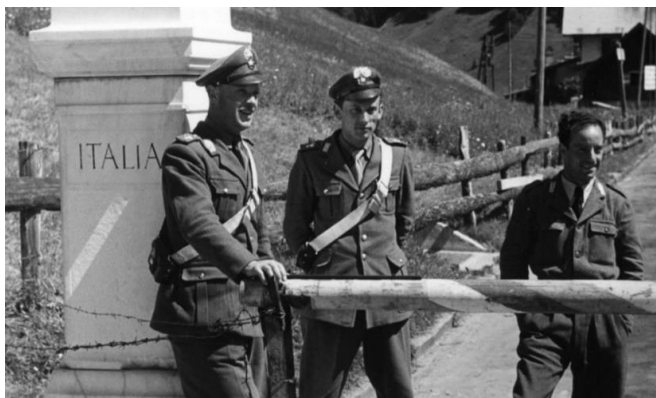
La Frontiera Italia Austria nel 1949

Esattamente 15 anni: tanti sono trascorsi da quel 30 aprile 2004, quando a Vienna venne siglato l'Accordo di Stato Italia - Austria che di fatto determinava la nascita della BBT, la società chiamata a progettare ed eseguire i lavori per realizzare il tunnel del Brennero. Esattamente 15 anni dopo la stessa società ha tagliato il traguardo dei primi 100 km di gallerie scavati, per la precisione oltre 38 km di cunicolo esplorativo, 28 km di gallerie ferroviarie e 34 km di altre gallerie. La galleria di base del Brennero, infatti, è un sistema di gallerie ramificato per 230 km. Quindi, stando ai programmi, le opere saranno terminate nel 2027, mentre l'entrata in esercizio ferroviario è prevista per fine 2028. L'Accordo di Stato stabiliva che Italia e Austria avrebbero partecipato in pari misura ai costi di realizzazione. Un sostegno essenziale alla realizzazione viene fornito dall'Unione Europea che, con percentuali crescenti di cofinanziamento, ha sempre contribuito al progetto. Questo perché l'UE annovera la galleria di base del Brennero tra i progetti di maggior rilievo a livello europeo. Violeta Bulc, commissaria ai Trasporti dell'UE, ha parlato non a caso di progetto che avvicinerà gli Stati e renderà più efficienti e competitive le loro economie.